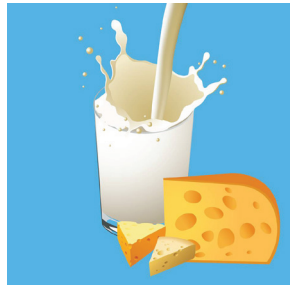
ผลิตภัณฑ์จากนม เช่น นมสดหรือชีส

หลังจากนั้นจึงมีการพูดคุยเกี่ยวกับการเกมจับคู่สัตว์ต่าง ๆ ให้สอดคล้องกับเนื้อหาในภาพยนตร์ เพื่อกระตุ้นให้นักเรียนกล้าแสดงออก สามารถร่วมกิจกรรมกับเพื่อน ๆ ทั้งได้รับความรู้ คำศัพท์ภาษาอังกฤษเกี่ยวกับสัตว์ และความสนุกสนาน โดยมีภาพเกมจับคู่สัตว์ (ดังภาพตัวอย่าง)