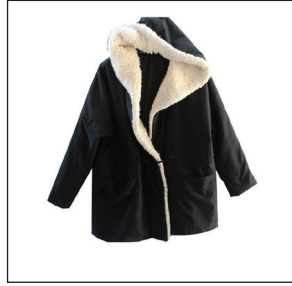
เสื้อกันหนาวขนแกะ