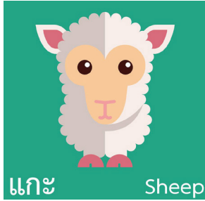
ภาพสัตว์ชนิดที่ ๑ : แกะ (Sheep)

ภาพตัวอย่างเกมจับคู่ภาพสัตว์และประโยชน์ของสัตว์แต่ละชนิด